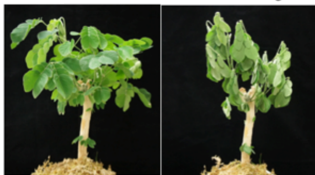
アメリカネムノキの就眠運動